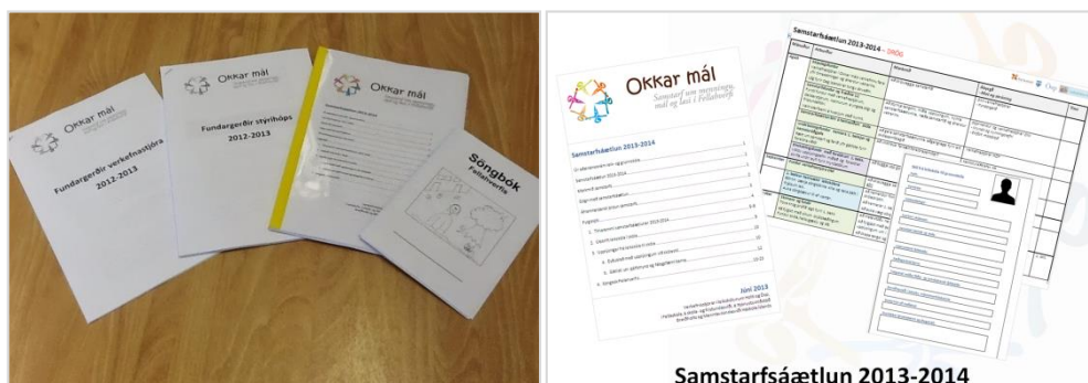
Myndir af fundargerðum frá fundum styrjihóps og verkefnastjóra, samstarfsáætlun 2013-2014 og söngbók Fellahverfis 2 .