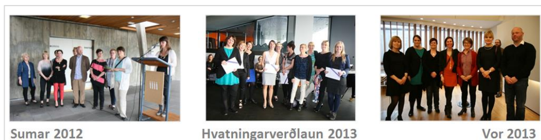
Myndir frá afhendingu styrkja og hvatningarverðlauna

Samlegð af samstarfi í verkefninu, þar sem skólar í Fellahverfi, þjónustumiðstöð Breiðholts, Menntavísindasvið Háskóla Íslands og skóla- og frístundasvið hafa lagt saman krafta sína, er um margt áhugaverð og getur (ef framhald verkefnisins verður í anda fyrsta starfsársins) orðið fyrirmynd að átaks- og þróunarverkefni í menntakerfinu. Í þessu samhengi er vert að geta þess að sú jákvæða athygli sem verkefnið hefur hlotið frá skóla- og frístundasviði og markviss stuðningur og hvatning frá skóla- og frístundaráði skiptir veigamiklu máli fyrir skólastarf í hverfi sem hefur jafnmikla sérstöðu og sóknarfæri eins og raunin er í Fellahverfi.