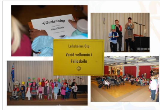
Myndir frá sameiginlegri útskrift elstu barna á leikskólunum sem fram fór í Fellaskóla.