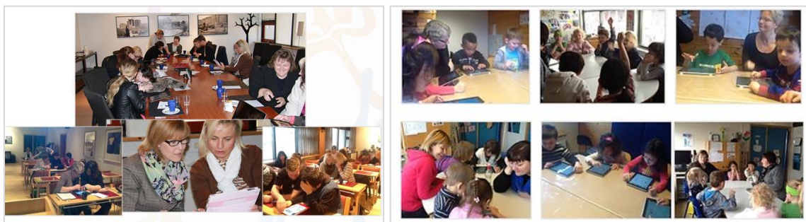
Myndir frá spjaldtölvunámskeiðum og spjaldtölvuverkefni kennaranema.