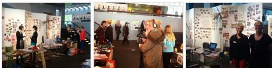
Myndir frá kynningum á stóra leikskóladeginum í júní 2013