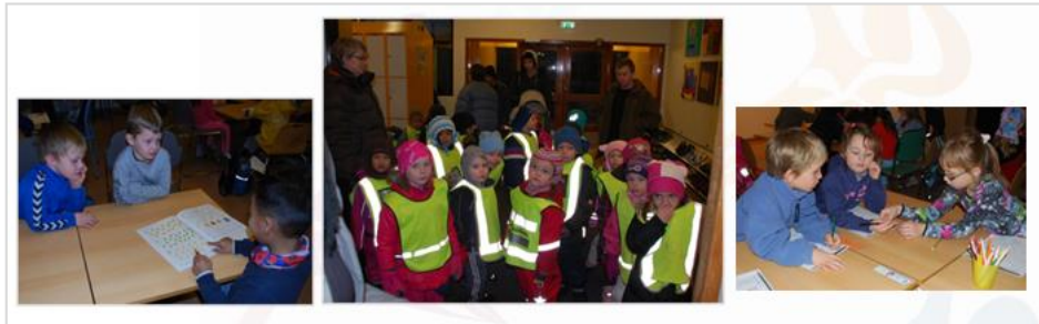
Myndir af mikilvægasti markhópnum

Á fyrsta starfsári Okkar máls verkefnisins hefur verið unnið að fjölbreyttum verkþáttum. Náðst hefur að leiða saman aðila, vinna með viðhorf og væntingar til samskipta og skipuleggja fræðslu er tengist menningu, máli og læsi. Jafnframt hafa verið stigin skref í verkefninu sem þegar eru farin að hafa mótandi áhrif á inntak, aðferðir og samstarf í skólasamfélaginu í Fellahverfi.