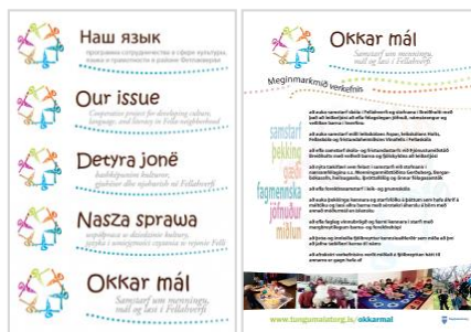
Mynd af veggspjald verkefnisins er nú til á albönsku, ensku, íslensku, pólsku og rússnesku