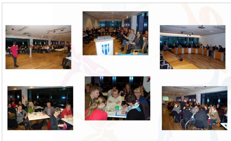
Myndir frá sameiginlegum starfsdegi 3. janúar 2013.