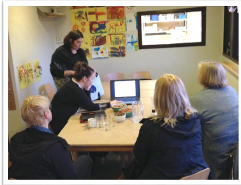
Mynd 3. Kynning á starfi leikskólanna fyrir kennurum Fellaskóla, nóvember 2014