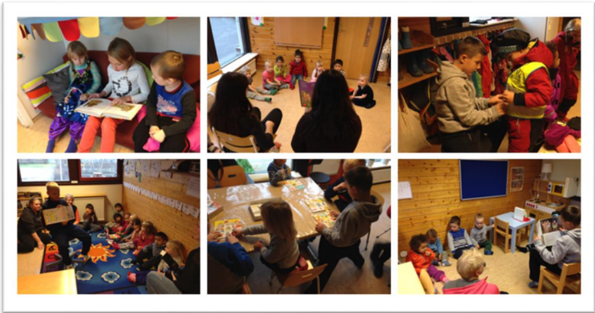
Mynd 4. Nemendur í 5. bekk lesa fyrir leikskólabörn á móðurmáli sínu.