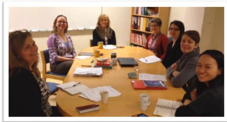
Mynd 7. Frá fyrsta fundi rannsóknarhóps á MVS-HÍ