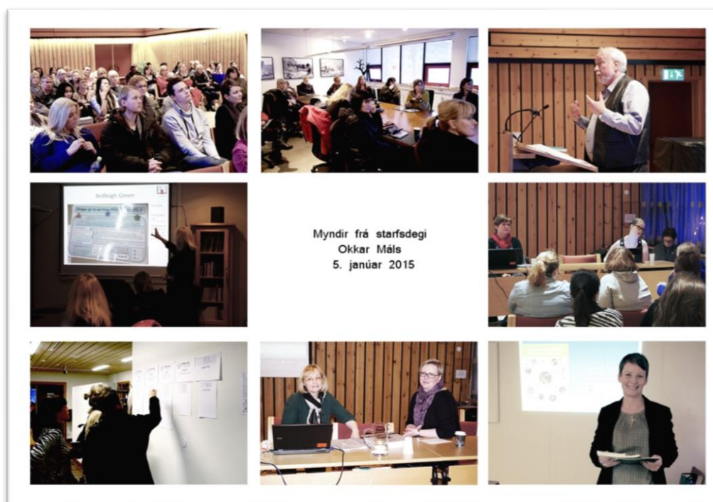
Mynd 2. Frá sameiginlegum starfsdegi í janúar 2015