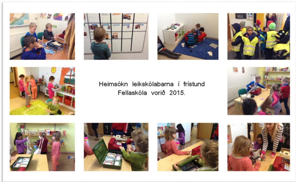
Mynd 5. Frá heimsókn elstu leikskólabarna hverfisins í frístund Fellaskóla.