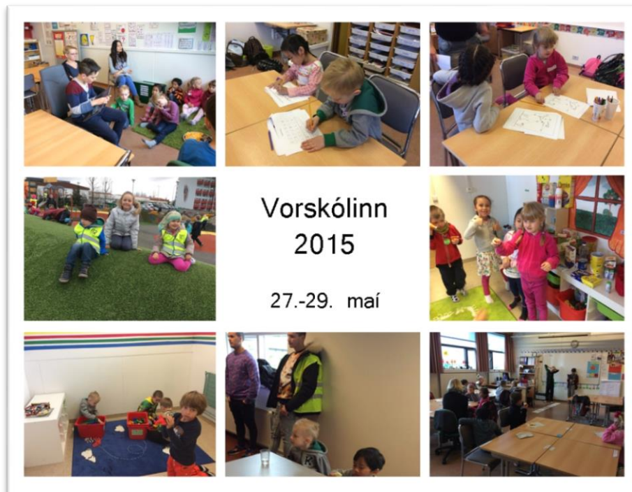
Mynd 6. Svipmyndir frá Vorskólanum.