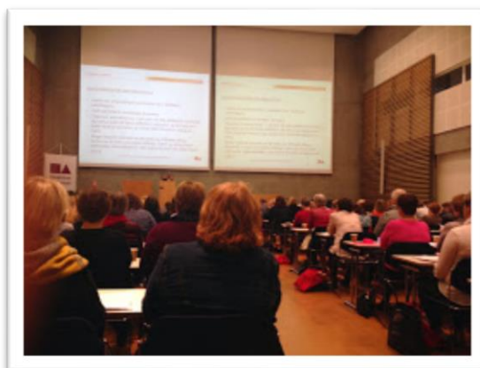
Mynd 9. Frá kynningum á læsisráðstefnu á Akureyri, september 2014.