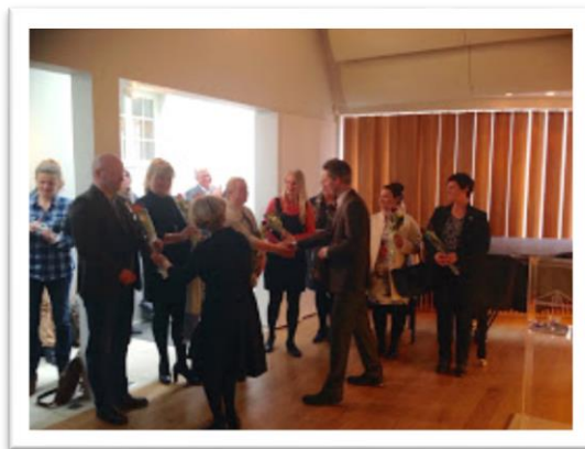
Mynd 8. Frá afhendingu þróunarstyrks Skóla og frístundasráðs, apríl 2015.