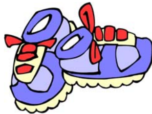
Þetta eru skór.