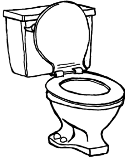
Þetta er klósett.