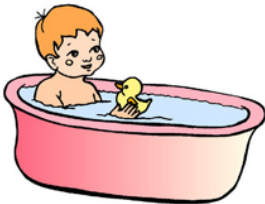
Klukkan er 20:00