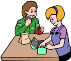
Klukkan er 12