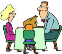
Klukkan er 6